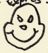
A cacher vers la TV

Le père Noël demanda à six lutins de l'aider à distribuer les cadeaux. Trois lutins ont pris froid, un se cassa la jambe dans la cheminée, et les deux derniers cassèrent des cadeaux sans faire exprès. Bien fait pour le père Noël !!